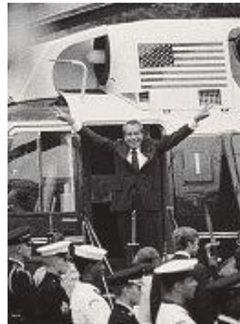
De aftocht van Nixon in 1974 in de Sikorsky VH 3A; de helikopter staat bij het museum.

Tot die tijd gold dat alle presidentiële documenten eigendom waren van een president en dat die mocht beslissen wat ermee zou gebeuren. Het Amerikaanse congres vreesde echter dat Nixon gevoelig materiaal zou vernietigen. Een inderhaast opgestelde wet wist dat te voorkomen en legde de basis voor de huidige regelgeving omtrent