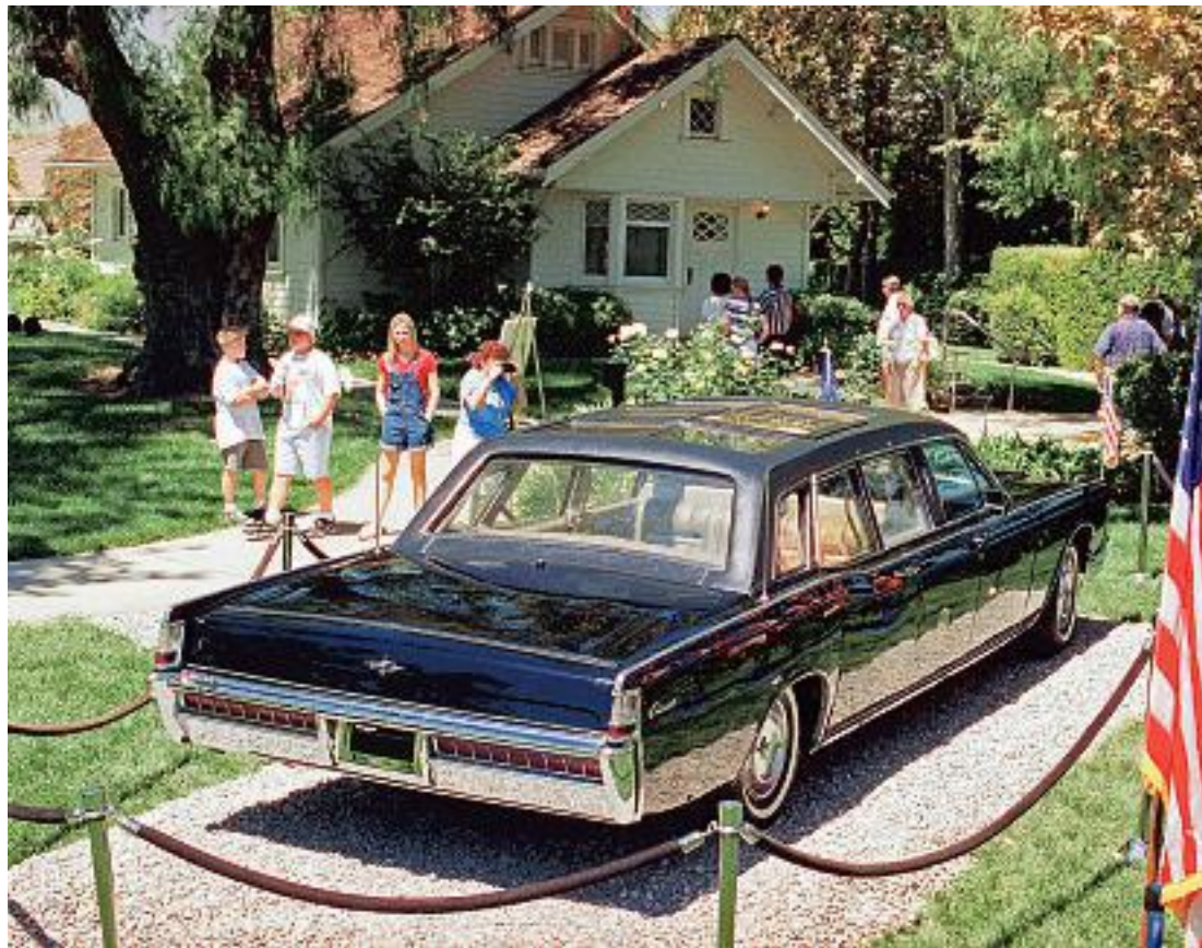
Nixons geboortehuis in Yorba Linda maakt ook deel uit van het complex; onder: Nixon tijdens een tv-uitzending over Vietnam.