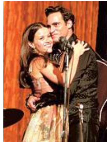
Reese Witherspoon met Joaquin Phoenix als Johnny Cash, in de film Walk the Line .