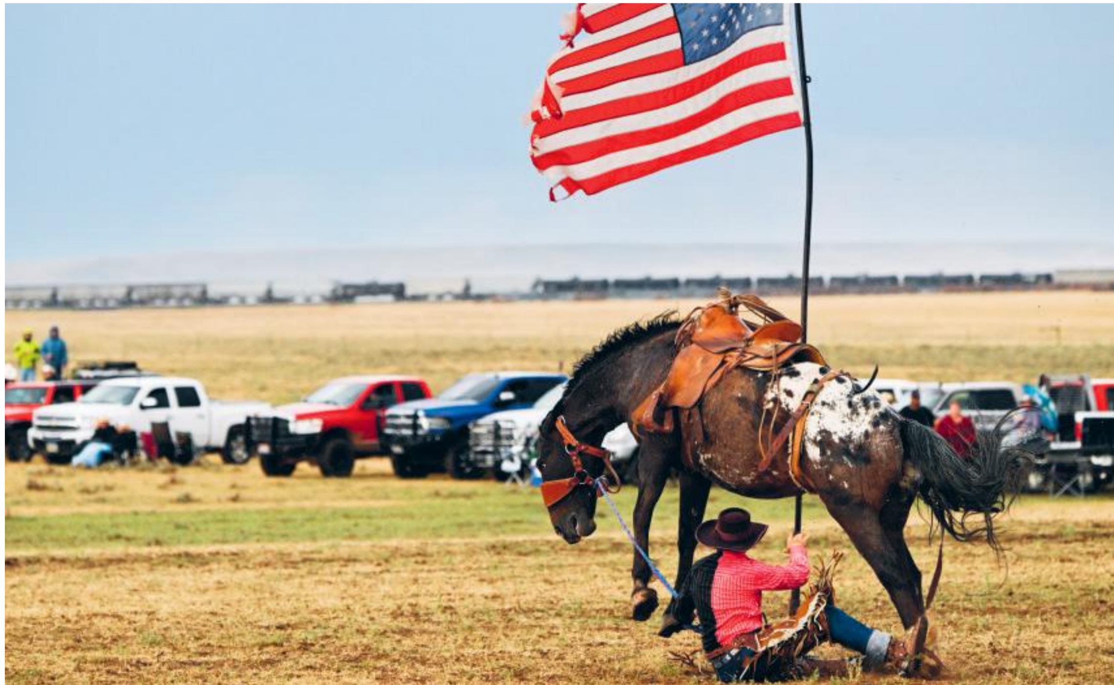
Tom Horn Days Cowboy Rendezvous rodeo in Bosler, Wyoming. De rodeorijder bijt in het stof, maar zal het er niet bij laten zitten. Cowboy is de lifestyle van freedom.

“ 'Beide politieke partijen zijn net zo disfunctioneel. Wij hebben het vermogen verloren om compromissen te sluiten'