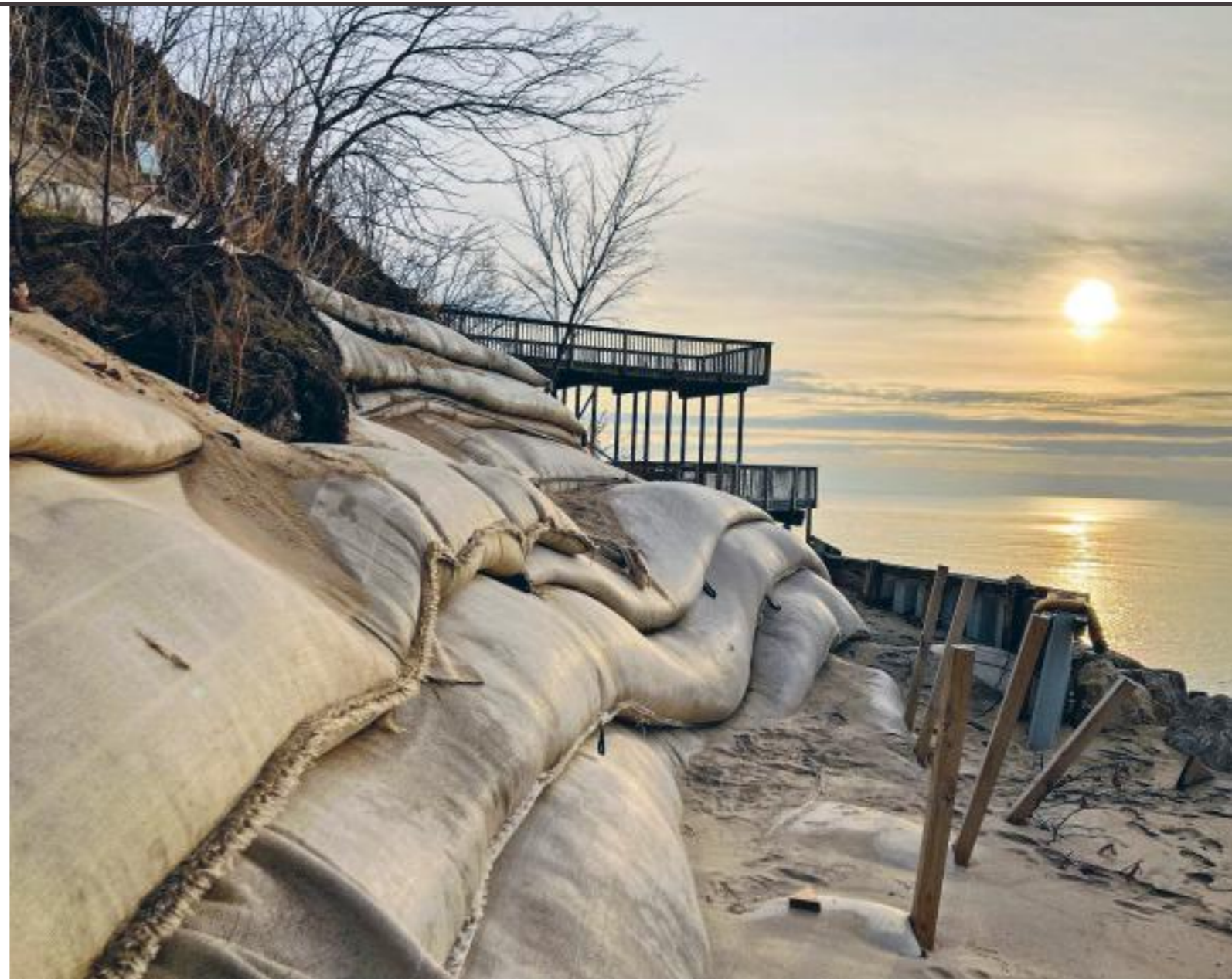
Het ooit weidse strand van Lake Michigan is nu een rommelig baaitje met grote zandzakken om het duingebied te stutten.

In februari 2020 liet Huizenga rotsblokken achter zijn strandhuis in Holland leggen om verdere erosie te voorkomen. Voor de bescherming van circa 30 meter breed betaalde hij $300.000.